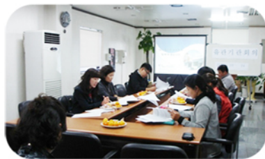
마음이 행복한 익산시를 위한 유관기관회의를 하였습니다.