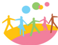
익산시정신보건센터 Iksan Mental Health Center

“익산시정신보건센터 홈페이지와 새로운 로고가 탄생되었어요. 앞으로도 많은 관심과 사랑 부탁드립니다~”