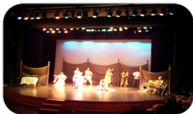
정신건강연극제 광대학교 “스타탄생” 연극도 보고 마음건강 정신건강 ^^